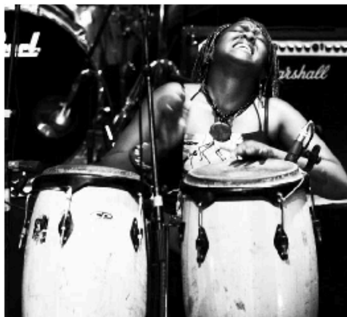
El Club Shanga, de Zimbabue, estarà de gira a Catalunya del 15 al 30 de maig del 2011.

Fer brillar el talent musical dels joves i escriure entre tots arpegis de solidaritat per un present i un futur ben afinats: si voleu participar a la iniciativa i conèixer l'immens talent dels joves implicats en el projecte, adreceu-vos a Music Crossroads International. Amb música com aquesta, el món de ben segur hauria de sonar millor.