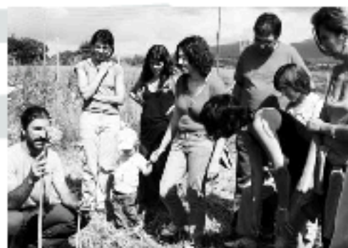
Horts Vitals de Cardedeu Tel.: 93 319 30 89 - hortsvitals.blogspot

Em demanen que destaquí una de les iniciatives: la Borsa d'Horts. A través del seu blog, qui necessiti un trosset de terra per plantar carxofes o sembrar bledes, pot demanar-ne; qui tingui un hort erm, pot cedir-lo, i a poc a poc ampliar el mapa verd, la consciència sostenible, per ensenyar amb l'acció que una vida diferent és possible i gens complicada recuperant aromes, sabors i equilibri per a tothom. ☺