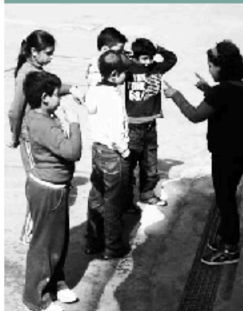
CEIP MOSSÈN JACINT VERDAGUER C. Lleida, 32. Barcelona - Tel.: 93 424 02 01

El CEIP Mossèn Jacint Verdaguer és una escola pública del barri Poble-sec de Barcelona. Actualment té un elevat nombre d'alumnes procedents d'altres països i hi conviuen dia a dia nens i nenes que conformen una gran varietat de cultures. Al curs de 4rt de primària, com a botó de mostra de la gran barreja de cultures que hi ha al barri, s'hi poden trobar nens i nenes procedents de fins a catorze països diferents. Aprofitant aquest fet, al curs 2009-2010 es va dur a terme un projecte des de l'àrea d'expressió corporal amb la idea principal de compartir i fer conèixer a cada alumne aspectes relacionats amb la seva pròpia cultura i la dels seus companys. Els resultats de l'experiència van ser molt bons, i l'equip de professors ho ha volgut difondre i compartir amb la comunitat educativa a través de CARRER.