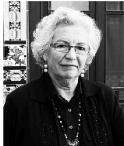
Assumpció Vilà va ser escollida Sindica de Greuges de Barcelona el passat mes de maig.

Assumpció Vilà i Planas és des del maig passat el cap de la Sindica de Greuges de Barcelona. Fins al 2015 té l'encàrrec de defensar els drets fonamentals i les llibertats públiques dels barcelonins i barcelonines i de tota persona que es trobi a la ciutat, sigui resident o no. La van escollir per consens i el seu principal objectiu és fer conèixer arreu de la ciutat la feina d'un organisme que rep entre 1.000 i 1.500 queixes l'any. Cap no queda sense resposta.