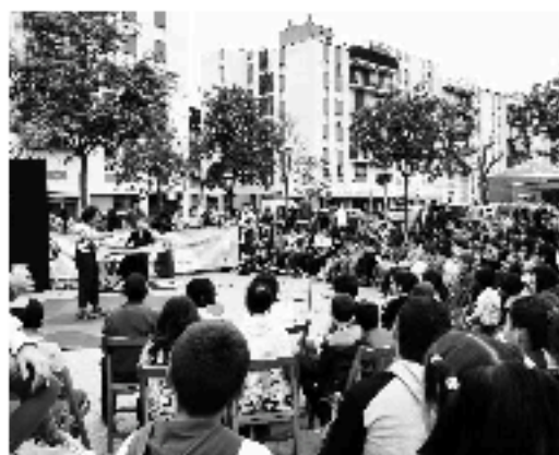
Civc Nk, al mos do maig a Santa Eugònia de Tor, a Girona

La cultura al carrer, prope- ra, participativa, motivadora, font de coneixement de les tradicions culturals del país... Amb les prop de quaranta activitats programades des d'octubre fins a Nadal (això ho escrivim a mitjans d'octubre, però n'hi haurà més) La Roda suma les seves eines de cultura a les de les entitats per avançar cap a una societat cada dia més cohesionada i participativa.