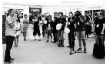
Presentació dels premis a la Fira de Tàrraga

Aquests premis distingiran la feina feta durant l'any des de diferents àmbits del món del circ i es dividiran en dotze categories (millor muntatge de sala, de carrer, còmic, familiar o millor escenografia...). Un jurat especialitzat els entregará a Barcelona el 20 de desembre en la gala La nit del circ , a la qual es convidarà artistes, programadors, mitjans de comunicació i institucions. Es fa d'aquesta manera un pas més en la consolidació del circ com a disciplina artística plenament reconeguda des de tots els camps de la cultura. Aquests nous premis, que s'afegeixen al Premi Nacional de Circ i als premis Sebastià Guasch, tenen el suport del CoNCA (Consell Nacional de les Arts i la Cultura).