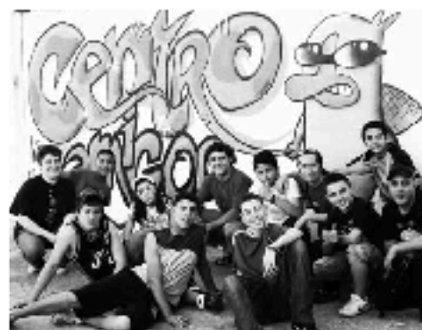
El No t'@turis d'avant l'obra feta el passat mes de maig