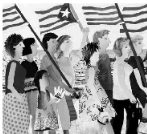
L'artista Balís Catmi s'ha inspirat en la manifestació del 10 de juliol per muntar l'exposició "Camíem!" ( www.pladelaalma.com ).

I és que el llistat d'entitats i organitzacions adherides a la manifestació és amplíssim i no